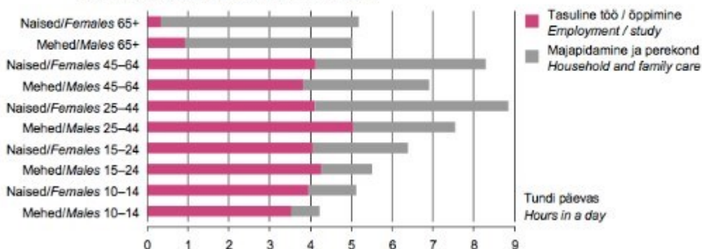
Figure 5. Average time spent in a day on employment and study, and on household and family care by sex and age group, 2009–2010